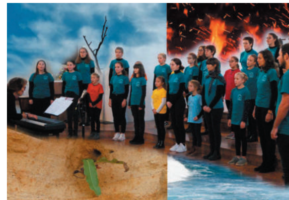
Kinder- und Jugendchor St. Jakobus